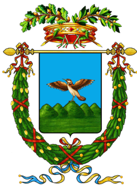
Provincia di Macerata